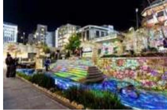
写真-10 姫路駅キャスルガーデン プロジェクションマッピング