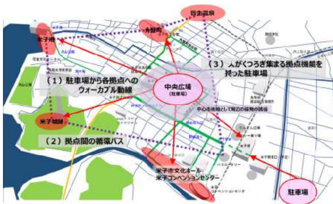
図-10 ウォーカブルシティ広域計画図

図-10 に示すように、中心市街地の中心に駐車場(兼イベント広場)を設置し、まちの中心から各拠点を結ぶ路線、また拠点同士を結ぶ路線を設定する。それにより、人が自然と集