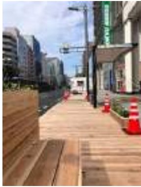
写真-2 車道上に設置したウッドデッキ