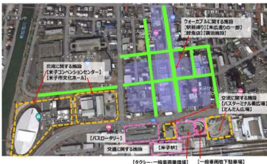
図-1 米子駅周辺の都市機能の配置状況

上記の分類により、米子駅北側は米子駅の正面に駅前通り、駅前通りに向かって左にバスロータリー、右にタクシー及び一般車両乗降場、一般車両地下駐車場出入口と米子駅の左右に交通に関する施設が配置されている。また左右の交通に関する施設の先に交流に関する施設が配置されており、米子駅周辺が米子駅を移動の発着点として効率的な施設配置となっている。