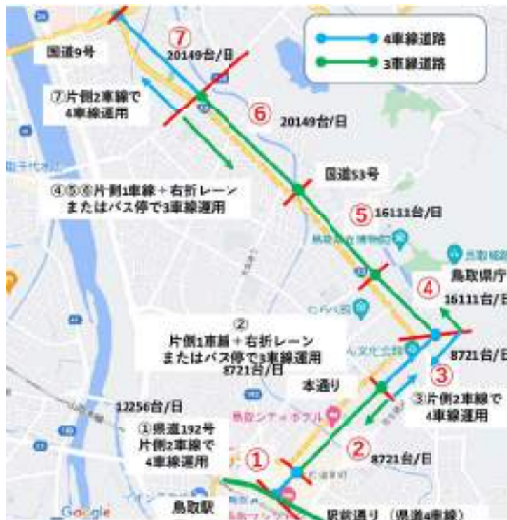
図-6 鳥取市内 鳥取駅から国道9号までの車線数