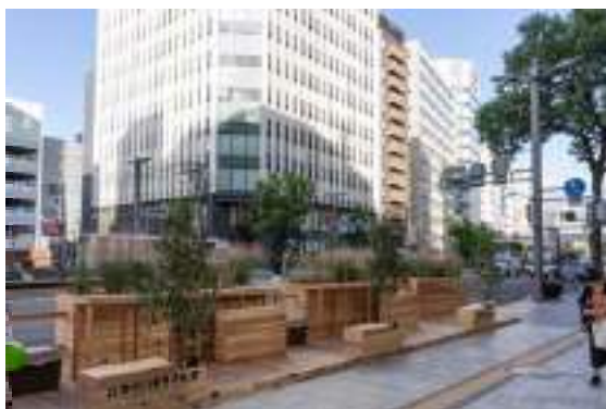
写真-1 歩行空間にグリーンやベンチを設置した例

P.6 図-4における「賑わいを目的とした空間 (2.6m)」に植木鉢や人工芝、ベンチなどを設置することで、駅前通りを歩く人、また沿道・周辺の飲食店を利用する人々に憩いの場を提供する。