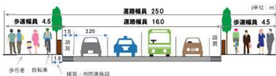
図-3 現在の駅前通りの道路構造

これらの状況を鑑みるに、人々が集い憩い多様な活動を繰り広げられる場となるために、歩くための環境を整え、駅前通りと米子駅、米子城跡、米子港、角盤町といった中心市街地をつなぎ歩きたくなるウォーカブル空間とするための施策が必要である。