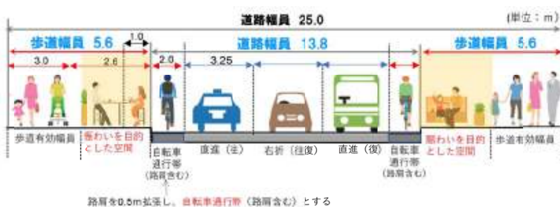
図-4 三車線化後の道路構造イメージ

歩道と車道の段差をできるだけ少なくし、バス停留所付近はバリアフリー空間にすることで、訪れる人だれもが安心して歩くことのできるウォークブルな通りとする。また、自転車は路肩に設ける専用帯を通行することとし、歩行者がより安全に歩けるように配慮する。