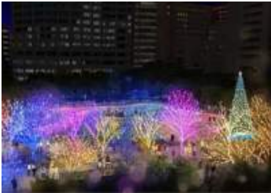
写真-11 博多駅前広場イルミネーション