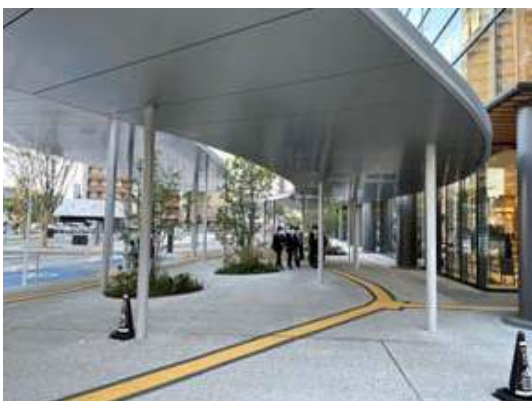
写真-17 JR熊本駅白川口の屋根付き歩道

エントランスゾーン（米子駅）から交流ゾーン（駅北広場、だんだん広場、文化ホール、コンベンションセンター）、ウォークアブルゾーン（駅前通り）、モビリティブロックへの誘導をスムーズに行うために、歩道環境整備の一環として、山陰の気候に配慮した屋根付き歩道を提案する。屋根及び天井材には県産材または木目調のパネルを使用することで、モビリティブロックや交流ゾーンへ温かくもてなす。天井には暖色系の照明を設け、足元には目的地（バス乗り場、コンベンションセンター等）に応じたカラー舗装をすることにより、来訪者にも優しい誘導を演出できる。