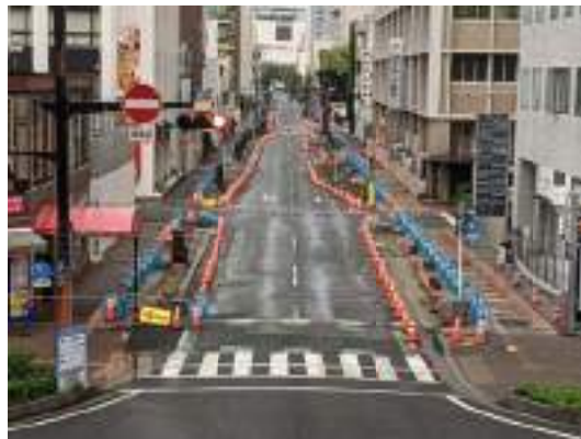
写真-20 岡山駅前イオン 一車線化道路