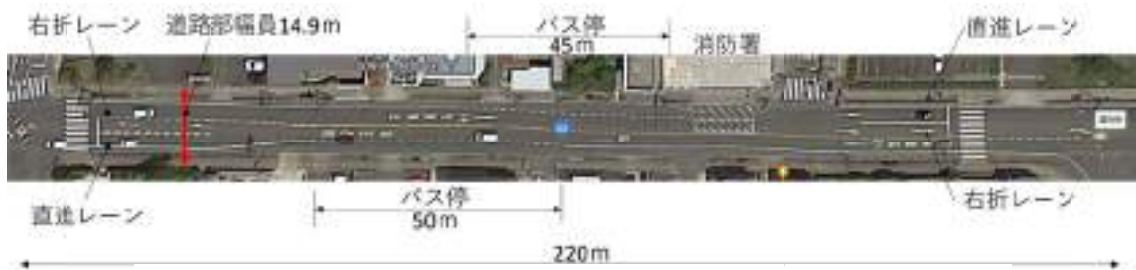
図-9 鳥取市内 国道53号線の三車線の一例（鳥取消防署東町出張所付近）