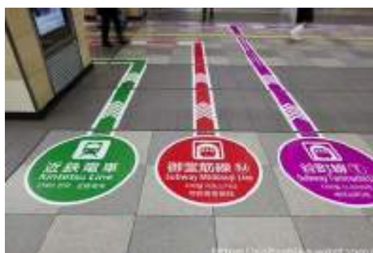
写真-13 JR天王寺駅の床面案内サイン

このモビリティブロックは、エントランスゾーンから市内や観光地へ向かう公共交通の発着点である。公共交通の利便性を向上させるための重要な要素は、どこに行けば乗れるか、いつ次の便がでるか、どこに向かうか、といった情報のわかりやすさである。例えば、駅構内または駅を出てすぐの足元に「高速バス」「路線バス」「タクシー」「一般車」「駅北広場」「コンベンションセンター」といったカラー舗装表示があると米子駅を初めて訪れた観光客にとってもわかりやすい案内表示となる(写真-13～写真-15)。また、米子空港の到着口に設置してあるデジタルバス時刻表もわかりやすい案内表示として参考となる(写真-16)。