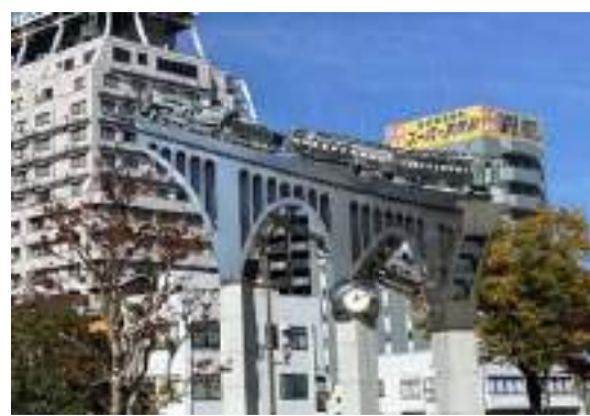
写真-12 だんだん広場の鉄道モニュメント