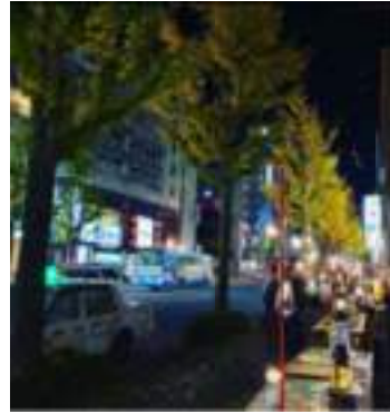
写真-3 令和2年度米子駅前ストリートテラスの様子

こうした非日常的なイベントを定期的に行うことにより駅前通りを訪れるようになった人々が駅前通りに愛着を持ち、日常的に駅前通りが人々の憩いの場となることを期待する。同時に、イベント主催者と出店者、沿道・周辺の店舗の交流が活性化しさらなる駅前通りの新たな価値創造につながると考える。