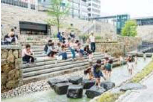
写真-9 広場（姫路駅キャスルガーデン）に併設されたカフェ（階段後方にカフェ）