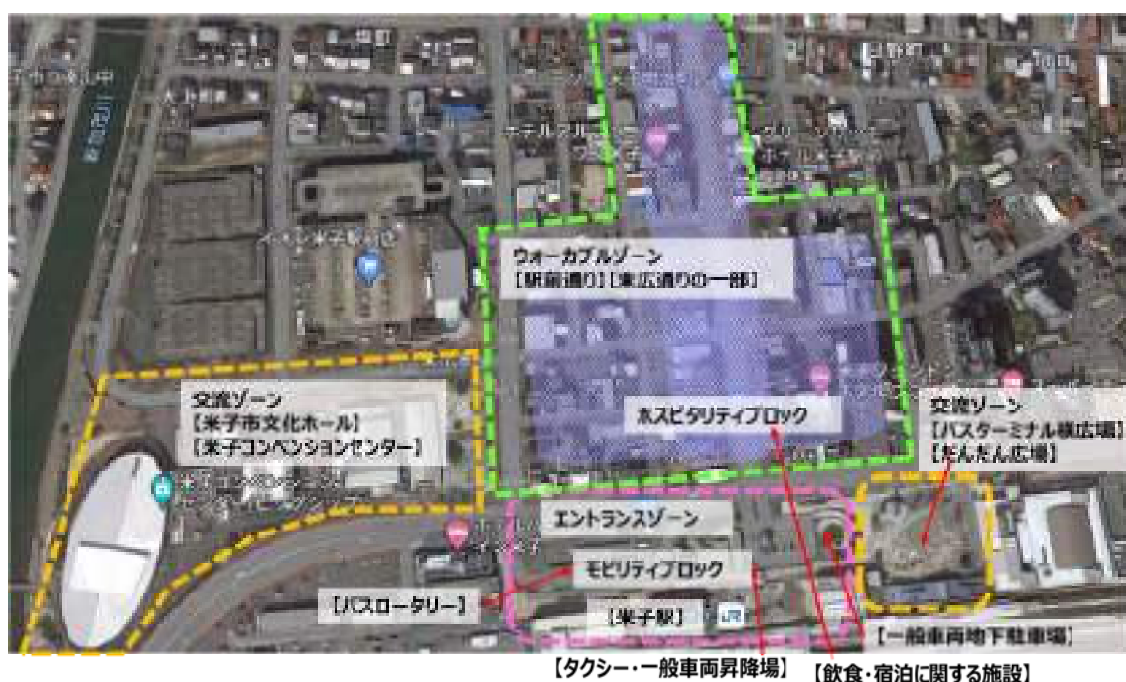
図-2 米子駅周辺のゾーン設定

※飲食・宿泊に関する施設はホスピタリティブロックとして設定し、ウォーカブルゾーンにおける日常的なコンテンツとして機能する。