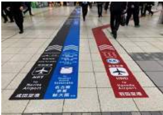
写真-15 品川駅の床面案内サイン