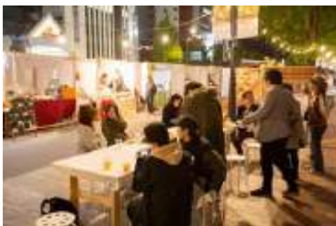
写真-4 姫路市 社会実験「ミチミチ」の様子

私たち米子 YEG の事業である「よなご・マルシェ」では、飲食店や体験型のワークショップなどの出店があり、米子の賑わい創造に貢献している。その実績から、「食」や「体験」が集客のコンテンツになることを実感している。また、米子商工会議所では中心市街地の各店を飲み食べ歩きするイベント「よなごバル」を開催している。そこで、米子駅～湊山公園・米子城跡、角盤町への誘導を想定し、駅前通りも出店スペースとして中心市街地が包括的に賑わい創造の場となる「まちなかまるごとマルシェ」や「まちなかよなごバル」のようなイベントも提案したい。