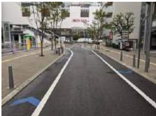
写真-19 岡山県庁通りの一車線化

ンセンターの立体駐車場への動線を確保することで、駅周辺の駐車場を分散化することができる。車と共存し、人と車が安全にそれぞれの通行空間を利用できるような整備が望まれる。