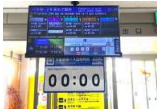
写真-16 米子空港のバス時刻案内表示