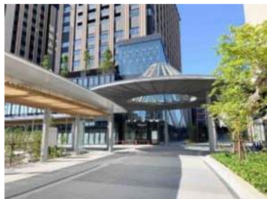
写真-18 JR金沢駅西口歩行者専用通路