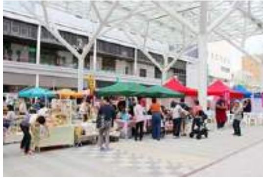
写真-8 博多駅クリスマスマーケットイベント