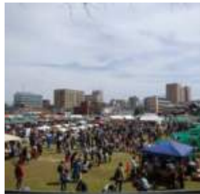
写真-5 令和2年度よなご・マルシェの様子