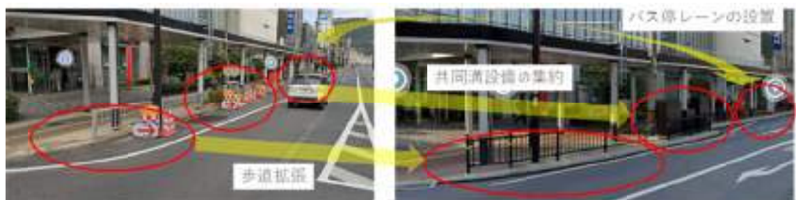
図-8 鳥取市内 国道53号線の歩道拡張と共同溝施設配置の一例（鳥取市栄町）