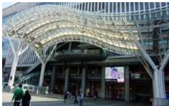
写真-6 博多駅大屋根と大型ビジョン

また、屋根のある駅北広場に大型ビジョンを設置することで、ひとときのくつろぎを提供し、人の滞留につながる。この大型ビジョンはデジタルサイネージとして利用することも可能である。