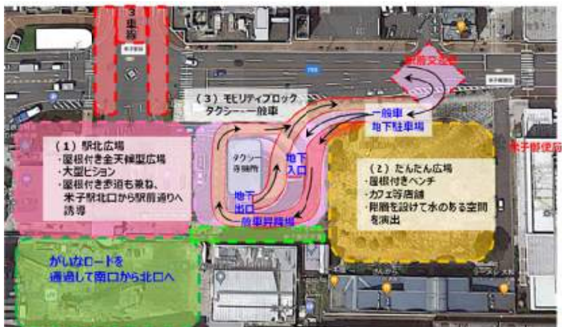
図-11 タクシー乗り場及び一般車両の進入路の配置イメージ

このモビリティブロックは、エントランスゾーンから市内や観光地へ向かう公共交通の発着点である。公共交通の利便性を向上させるための重要な要素は、どこに行けば乗れるか、いつ次の便がでるか、どこに向かうか、といった情報のわかりやすさである。例えば、駅構内または駅を出てすぐの足元に「高速バス」「路線バス」「タクシー」「一般車」「駅北広場」「コンベンションセンター」といったカラー舗装表示があると米子駅を初めて訪れた観光客にとってもわかりやすい案内表示となる(写真-13～写真-15)。また、米子空港の到着口に設置してあるデジタルバス時刻表もわかりやすい案内表示として参考となる(写真-16)。