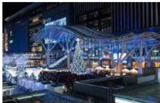
写真-7 博多駅マーケットイベントとイルミネーション