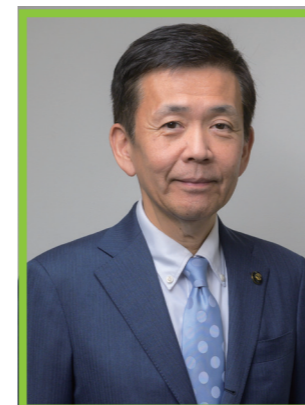
青森市長 西 秀記

結びに、ジュニアエコノミーカレッジ事業活動のますますの活性化とともに、本サミットに御参集の皆様の御健勝と更なる御活躍をお祈り申し上げ、お祝いの言葉といたします。